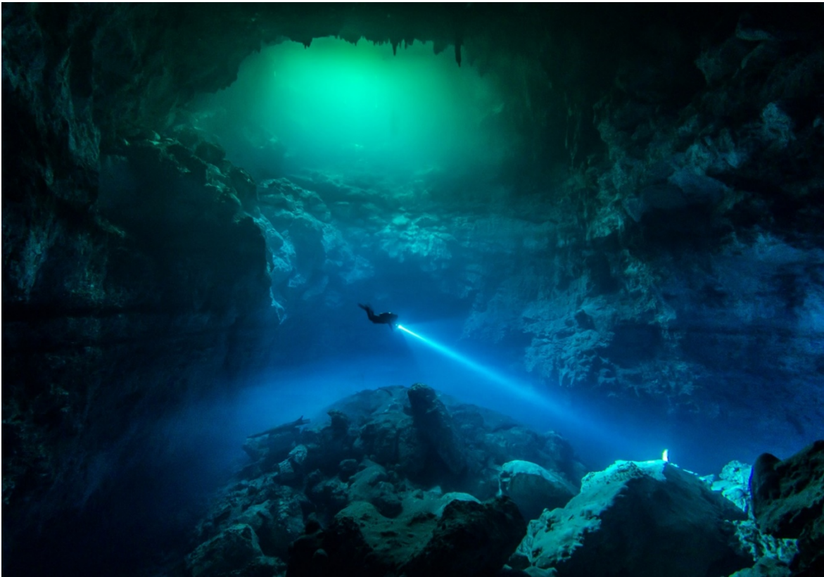
CENOTE at TULUM, MEXICO