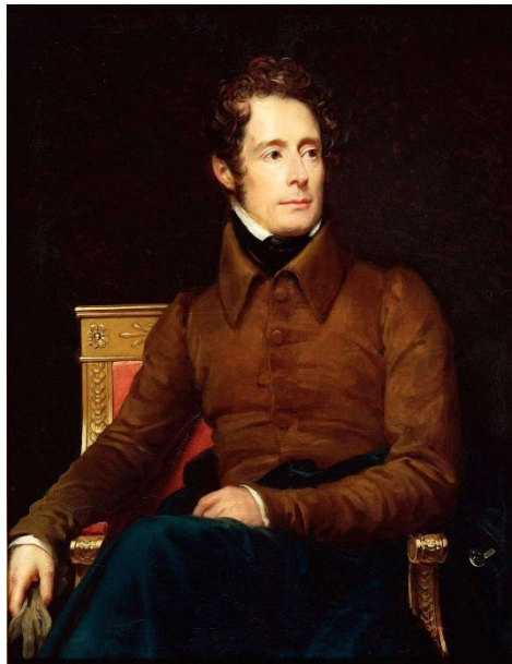
Alphonse de Lamartine (1831)

*** tramas armónicas cromáticas y hasta disonantes : quintas paralelas, escalas de tonos enteros, series paralelas de triadas (acordes de 3 notas) disminuídas o aumentadas, disonancias no resueltas, etc.