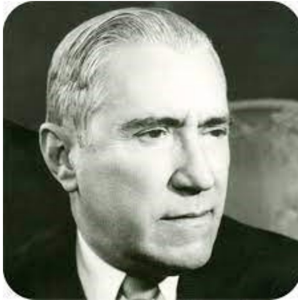
José Gorostiza Alcalá (Mexico, 1901 – 1973)

Even though several poetry collections include some of his poetries, Gorostiza himself published only two poetry books*: Canciones para cantar en las barcas ( Songs for singing on the barges , 1925) and particularly Muerte sin fin ( Death without end , 1939). Known as the "poet from smartness" for his deep and subtle approach, Gorostiza was both a brave artist and a demanding researcher of the lyrical "gist" that can be perceived in words, when language is reduced to its utmost purity and transparency.