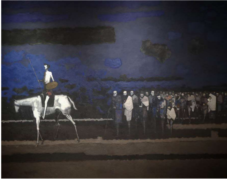
DON QUIJOTE EN EL EXILIO (1973) (Don Quijote in exile)

Painting (detail) by Antonio RODRÍGUEZ LUNA*