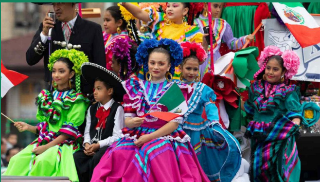
CELEBRATING MEXICO'S INDEPENDENCE (September 16th)

Foro CASTALIA – SEMINARIO DE CULTURA MEXICANA, Polanco – MEXICO CITY – 21 /MAY/ 2022