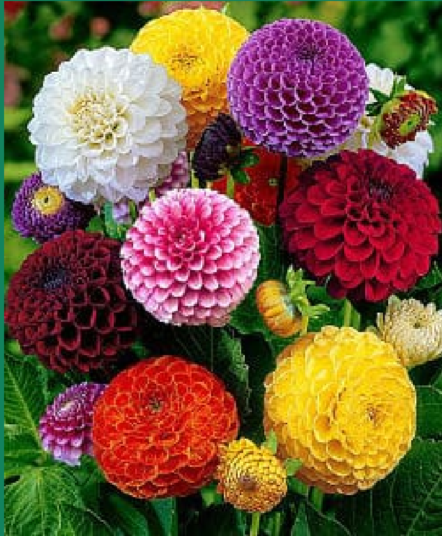
ACOCOCHITL (Asteraceae) DALIAS / DAHLIAS