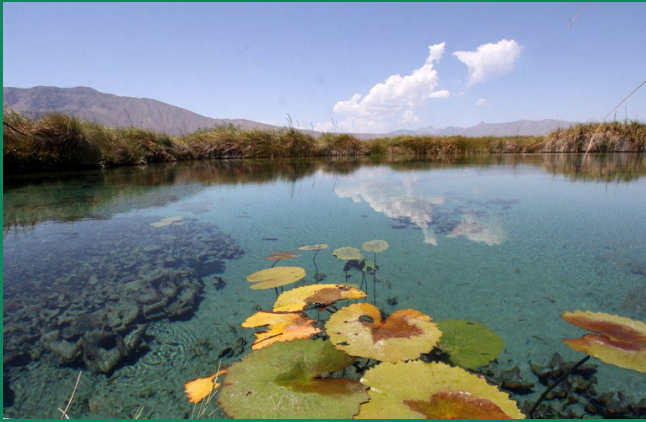
Pozo Azul – CUATRO CIÉNAGAS / Coahuila (MEXICO)

CANCIONES POPULARES ESPAÑOLAS G.40, no.5 (1914) (Folk Songs from Spain)