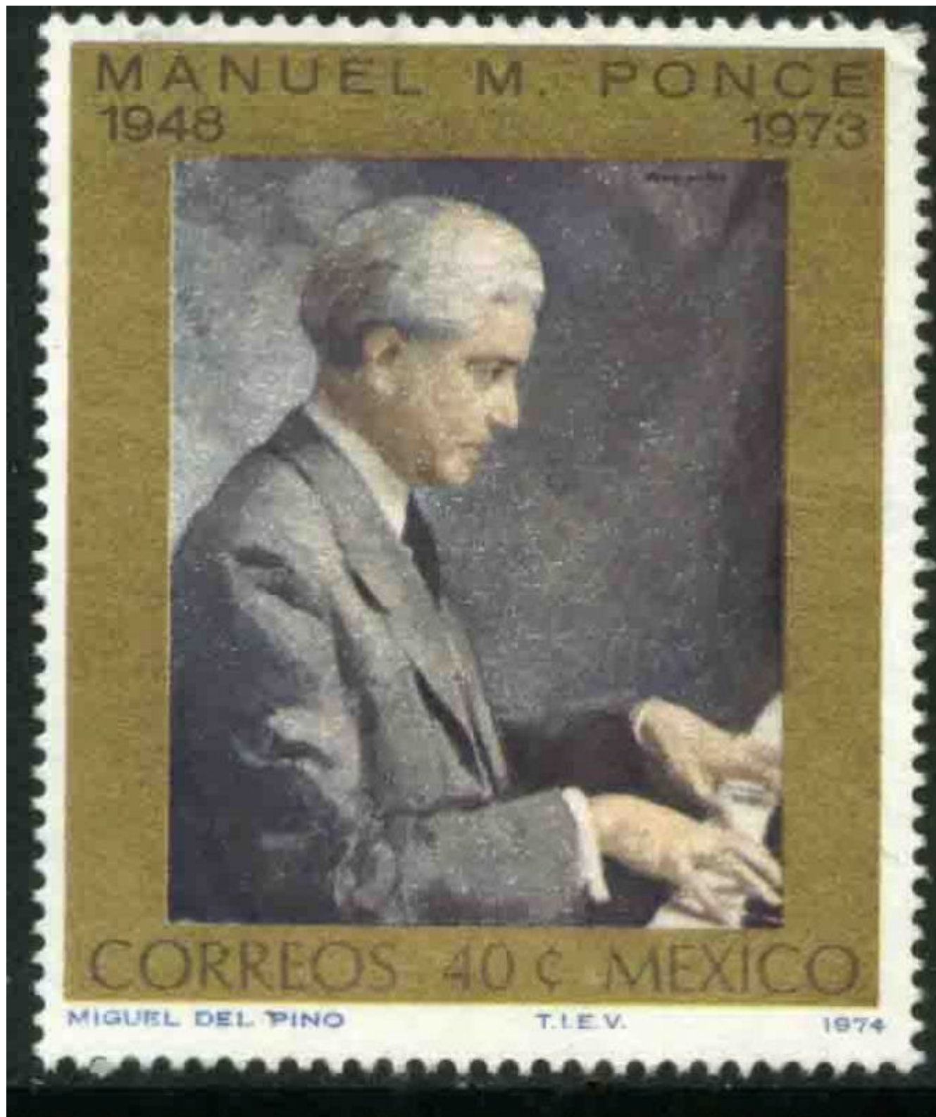
Manuel M. PONCE (México, 1882 - 1948)