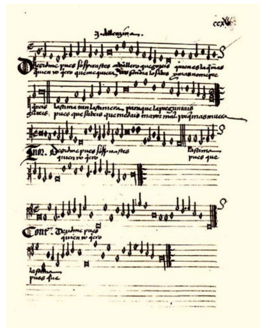
J. del ENCINA - Cancionero Musical de Palacio